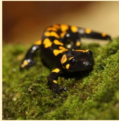
Foltos szalamandra (Fire Salamander)