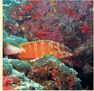
Epinephelus fasciatus (Blacktip grouper)