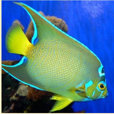
Sertefogú hal (Queen angelfish)