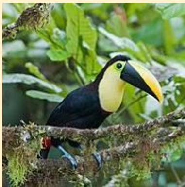
Parti tukán (Choco toucan)