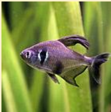
Fekete Fantomlazac (Black phantom tetra)