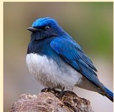
Éjkék légykapó (Blue-and-white flycatcher)