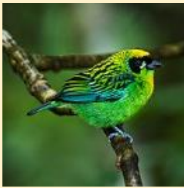
Amazoni tangara (Green-and-gold tanager)