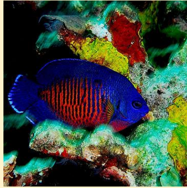
Püspöklila császárhal (Twospined angelfish)