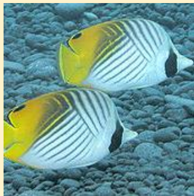
Chaetodon auriga (Threadfin butterflyfish)