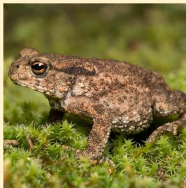
Barna varangy (Common toad)