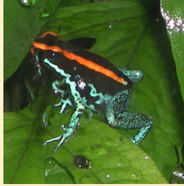
Sávós nyílméregbéka (Striped poison dart frog)