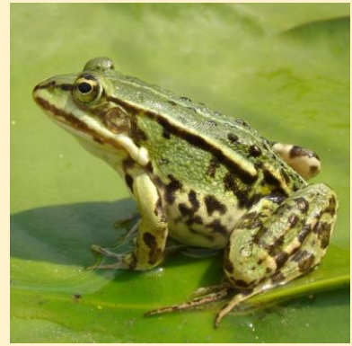
Kecskebéka (Edible Frog)