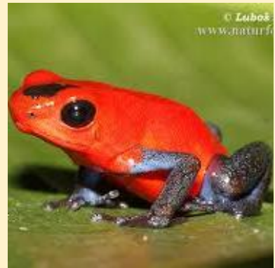
Eperbéka (Strawberry poison dart frog)