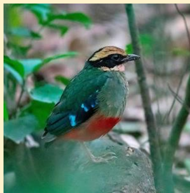
Zöldmellű pitta (Green breasted pitta)