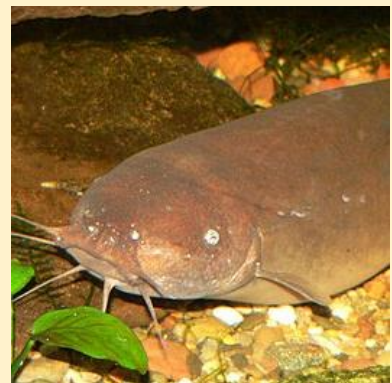
Malapterurus electricus (Electric catfish)