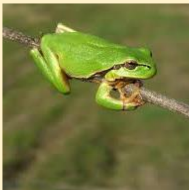
Zöld levelibéka (European tree frog)