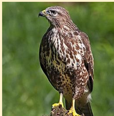
Egerészölyv (Common buzzard)