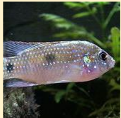
Anomalochromis thomasi (African Butterfly Cichlid)