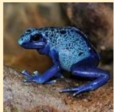
Kék nyílméregbéka (Blue poison dart frog)