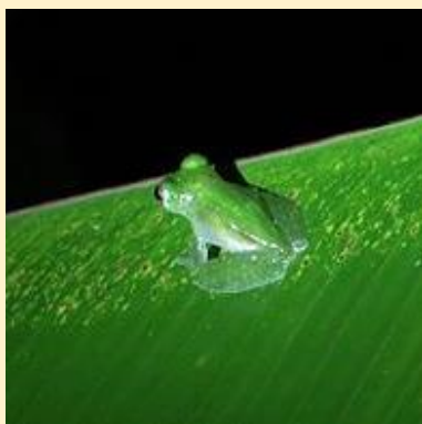
Hálómintás üvegbéka (La Palma glass frog)