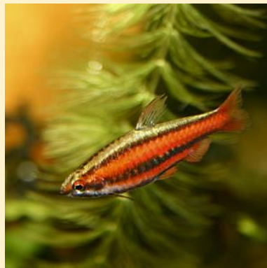
Nannostomus mortenthaleri (Coral red pencilfish)