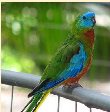
Ékes fűpapagály (Turquoise parrot)