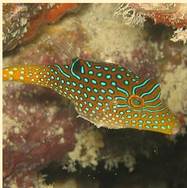
Canthigaster papua (Hawaiian blue puffer)