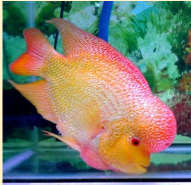
Flowerhorn cichlid (Hybrid)