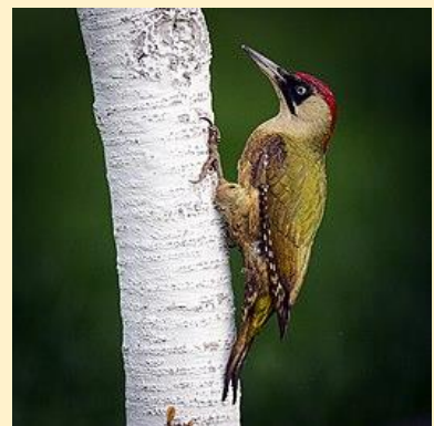
Zöld küllő (European green woodpecker)